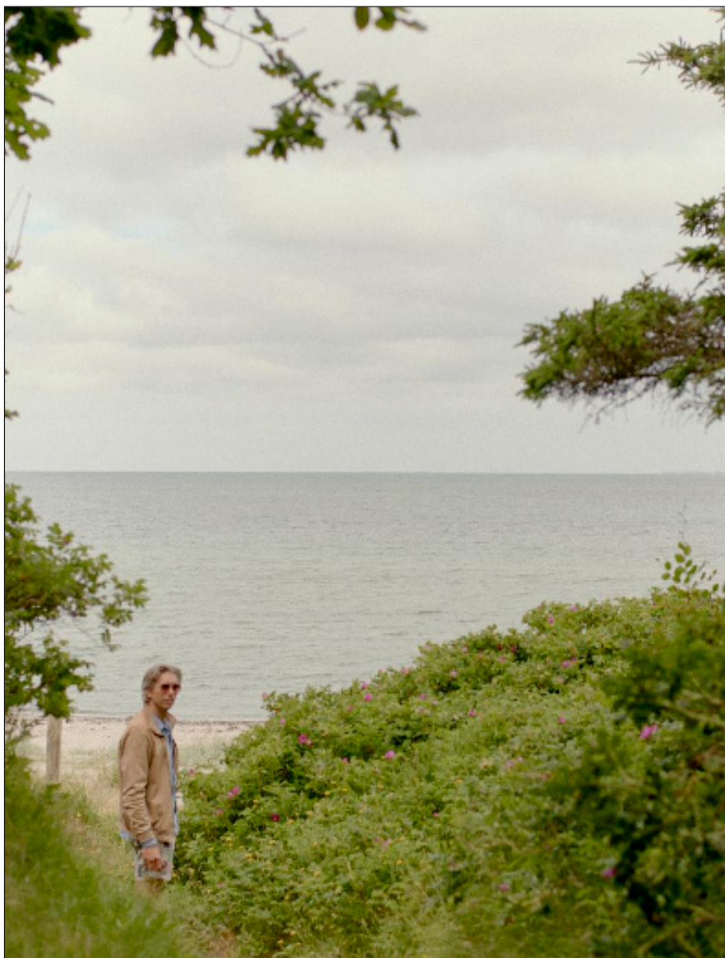
80 meter fra huset ligger stranden, hvor hele familien ynder at bade året rundt.