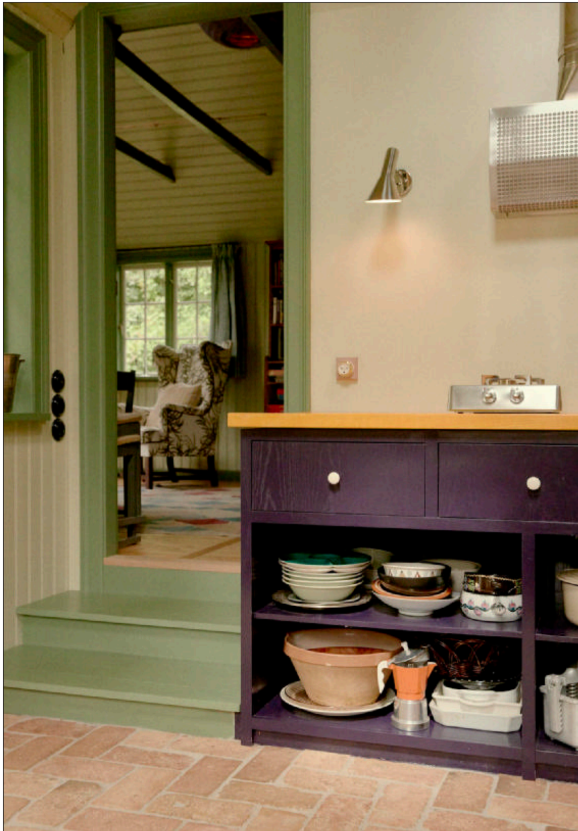
Kig fra køkkenet til stue. De fleste lamper er fundet hos antikvarer, de to Arne Jacobsen-væglamper er en nyudgave fra Fritz Hansen.